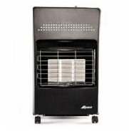
ESTUFA GARRAFERA ALPACA UK 18B