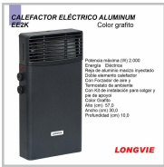
CALEFACTOR ELECTRICO LONGVIE 2000W GRAFITO TURBO- CONVECTORES EE2K