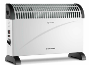
CONVECTOR ELECTRICO KENBROWN 2000W C/ TURBO KB18