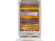
ESTUFA ELECTRICA KEN BROWN KB2001