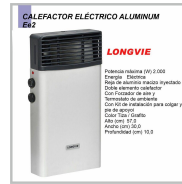
CALEFACTOR ELECTRICO LONGVIE 2000W TIZA TURBO- CONVECTORES EE2