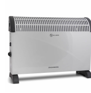
CONVECTOR KEN BROWN 2000W KB16