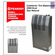
CALEFACTOR PEABODY TIRO BALANCEADO 2500 GN